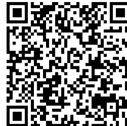
Figura 3. Instrumento presencial

Nota. El objetivo principal de los instrumentos es evaluar cómo se sintieron los estudiantes de la carrera de Diseño de Modas con la información proporcionada, la actividad desarrollada, el trato de los expositores, el material proporcionado y el mensaje transmitido.