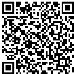
Figura 2. Instrumento digital